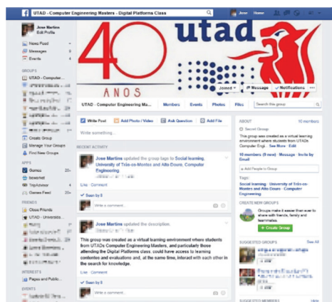
Figura 2 – Criação do grupo no Facebook que serviu como ambiente virtual de aprendizagem

Para que as atividades letivas possam iniciar, o professor apresenta aos alunos um link para uma pasta especialmente criada num repositório online (Google Drive), que contém todos os materiais e recursos didáticos necessários para a fase inicial. Posteriormente, o professor terá de dividir os alunos em grupos e apresentar a atividade de avaliação diagnóstica que vão ter que concluir num curto período de tempo. Quando todos os alunos apresentam as suas respostas à referida atividade, o professor avalia a resposta de cada aluno e comunica individualmente a sua classificação identificado problemas e preocupações.